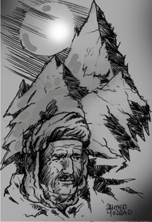
Desen: Ahmet YOZGAT