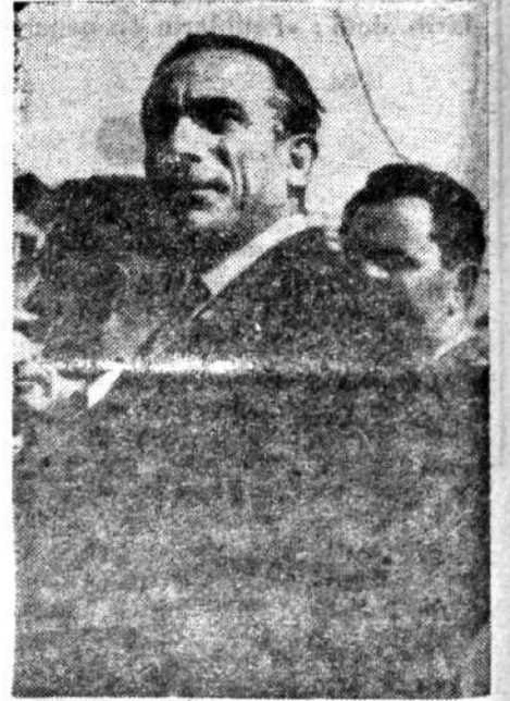
ALPARSLAN TÜRKES (Söz bir, Allah bir!..)

Demeç, basında, siyasi çevrelerde ve 27 Mayıs'tan menfaatlenen Tabii senatörler arasında çeşitli tefsirlere yol açtı. 1960 sonrası siyasi gelişme