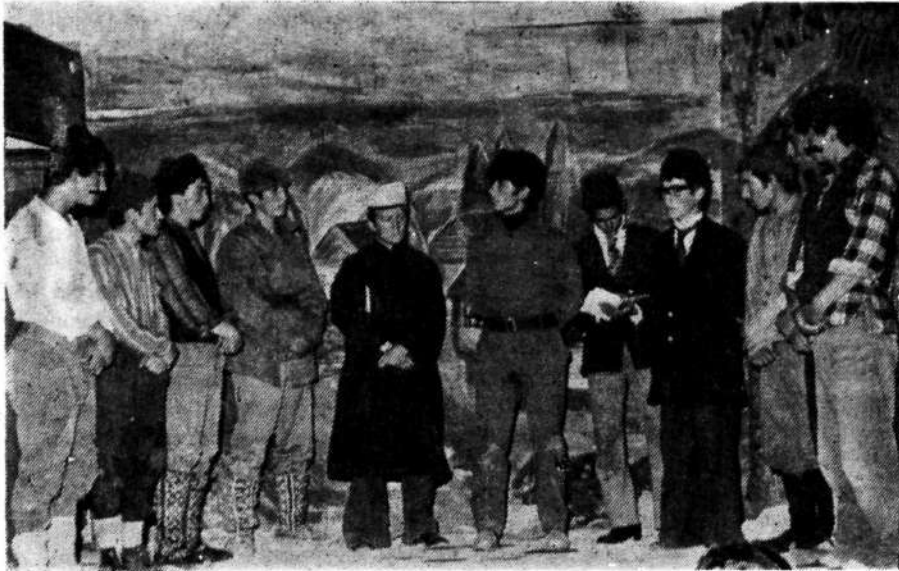
Koyulhisar'lı ülkücülerin sahneye koyduğu piyesten bir sahne.

Koyulhisar ülkücü gençleri tarafından 30 Ağustos «Müzik ve Zafer Şöleni» adıyla tertiplenen gece Koyulhisar'lı-