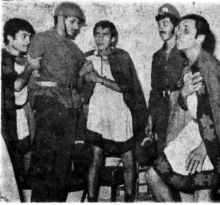
Ceyhan'da ülkücü öğretmenlerin sahneye koyduğu oyundan bir sahne.

Van'lı ülkücüler tarafından Bitlis Kağıt Spor Salonunda sahneye konan «Moskof Sehpa» isimli oyun halk tarafından büyük alaka toplanmıştır. Gelen haberlere göre salonu hınca hınç dolduran Bitlis'liler oyun sırasında sık sık tezahürat yapmışlardır. Büyük Ülkü Derneği Bitlis Şubesi gecenin gelirinin Türk Donanma Vakfı'na bırakıldığını açıklamıştır.