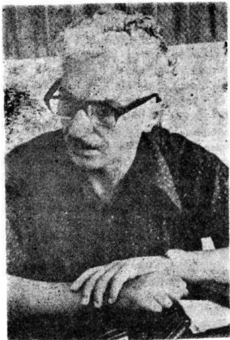
Aşırı solcu aktör Yılmaz Güney'in hâkimi öldürdüğünün kesin olarak anlaşılması üzerine açılan Savcı Cengiz Ataç.

Bu cümlelerden görüldüğü gibi Türkiye, aşırı solcuların gözünde Yunanistan'dan hiç de farklı değildir. Türkiye de Yunanistan gibi emperyalistlikle suçlanmakta, Türk askerinin adayı terk etmesi istenmekte, Türkiye'nin Kıbrıs üzerinde hiçbir hakkının bulunmadığı iddia edilebilmektedir. Ankara Devlet Güvenlik Mahkemesi bu bildiri üzerine