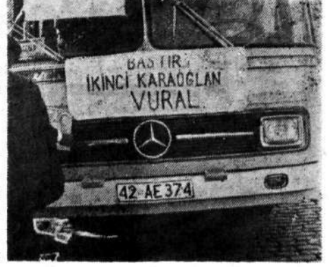
Dışardan getirilen aşırı solcu militanların otobüslerinde «2. Karaoğlan Vural» yazısı. Komünistler Ecevit'e ve CHP'ye sırtlarını dayamış halde seçimlere girdiler.

Seydişehir'deki seçimlerde CHP'lilerin partizanlığı ayan beyan ortaya çıkıyor. Ecevit'ten feyz alanların, adı bir gencin katledilmesine karışmış bir anarşiste «Karaoğlan» lığı yakıştıranların kimden cesaret aldıkları ve kim tarafından kışkırtıldıkları bu seçimlerde daha iyi anlaşıldı. Türkiye'yi 12 Mart'ta uçurumun kenarına getirenlerin yine aynı yolda oldukları ve bu sefer iktidarın müsamaha ve yardımından da istifade ettiği görüldü.