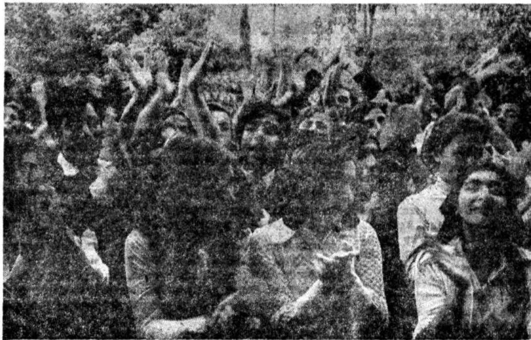
İçleri hürriyet hasretiyle yanan Kerkük Türklerinin gözler yaşartan gösterileri. Irak Türklerinin çileleri ne zaman bitecek? Onları gözleriyle gören Cumhurbaşkanı Korutürk'ün dinlediği dertlerin giderilmesi için gayret göstermesi bekleniyor.

nirına gelmiş ve boşalma duygusunun verdiği heyecanla sesleri daha bir gür çikıyordu.